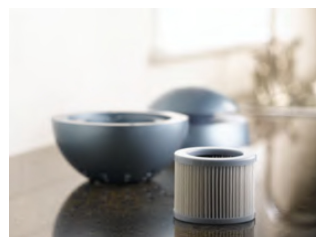
Włóż nowy filtr