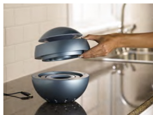
Otwórz górną pokrywę