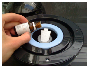
Umieść kilka kropeł olejku na wkładce zapa- chowej