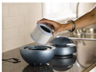
Usuń stary filtr