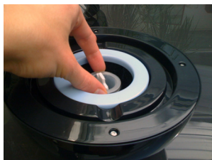
Wysuń wkładkę zapachową z urządzenia

Przy uzupełnianiu / wymianie olejka prosimy o postępowanie wg poniżej instrukcji: